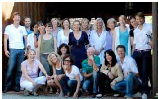
<< Il gruppo 2009 The Work™ Coach